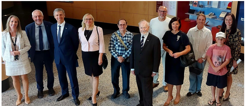
Vēstnieka kompānija ar Pertas latviešiem, Rietumaustrālijas mūzejā.

papildināt mūsu kompāniju. Mums bija speciāls pavadonis un jaunāka pavadone kuri mūs izvadāja pa muzeja svarīgajām vietām mūs brīdinot, ka lai visu redzētu mums būtu nepieciešams laiks ilgāk nekā vismaz veselu dienu. Mēs kāpām pa trepēm uz laukam kādu trešo vai, stāvu, un apkārt vitrīnām un redzējām gan Austrālijas dabas bagātības izraķeņos gan dabā. Varējām